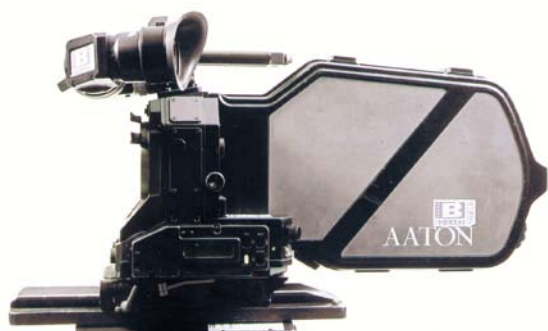
Aaton 35 III