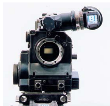
Aaton 35 III

Obturbateur équipé d'un miroir reflex monopole orienté à 45° bas / haut.