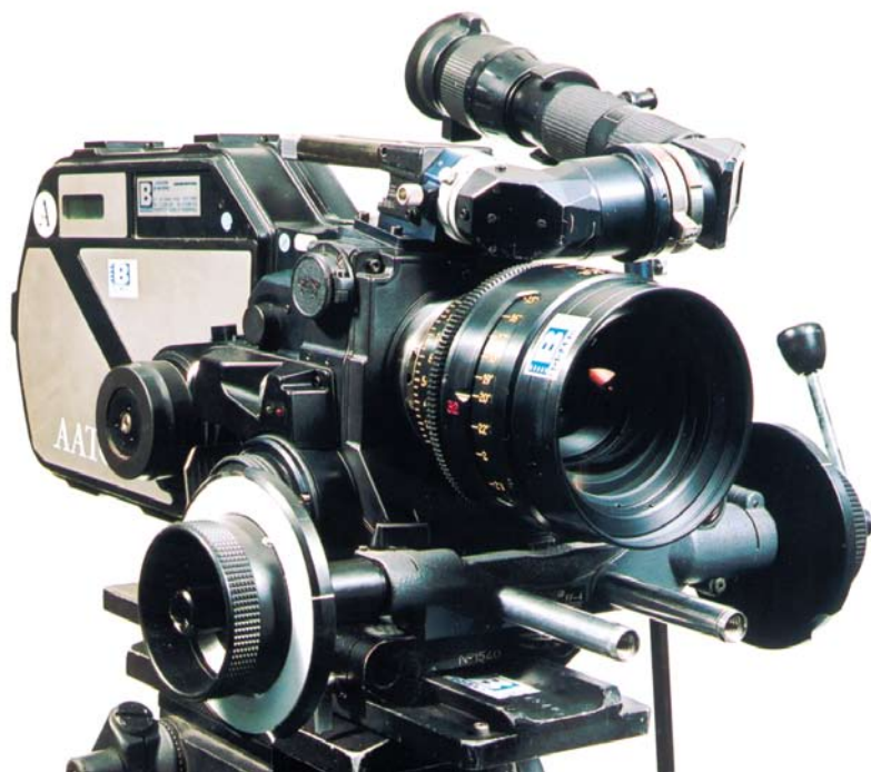
AATON 35 III (1997)