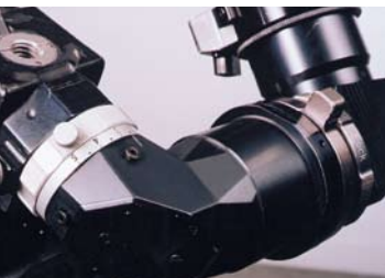
Réglage de dioptrie sur Aaton 35 III

Visée à prisme semi réfléchissant 75/25% pour reprise vidéo