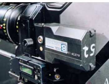
Détail de la batterie embarquée

Angle d'ouverture variable mécaniquement à l'arrêt. Multi-positions : 180°, 172.8°, 150°, 144°.