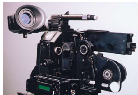
Détail de l'entraînement du magasin (magnétique)