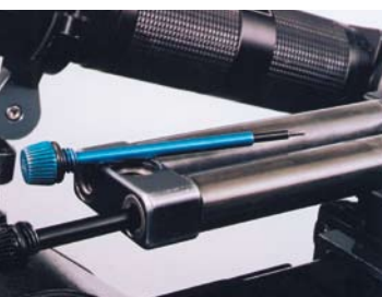
Outils intégrés à la poignée de transport (réglage angle d'obturation entre autres)